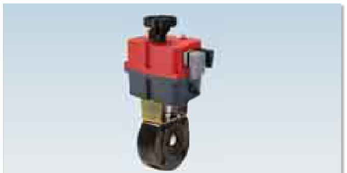
EH 85-240 VAC VDC